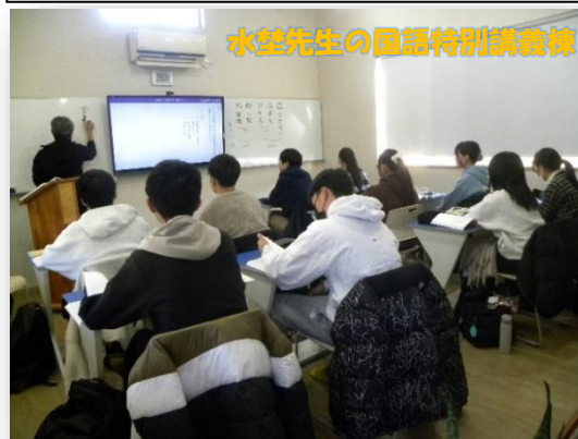
水望先生の国語特別講義棟

塾生・関係者の皆様に、感動・自信・夢・希 望を提供できますよう、スタッフ一同日々研鑽 して参ります。(塾長)